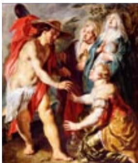
Якоб Йорданс, Христос в виде садовника является трём Мариям, около 1616 г.