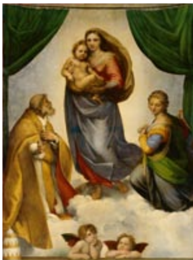
Рафаэль Сикстинская Мадонна, 1512/13