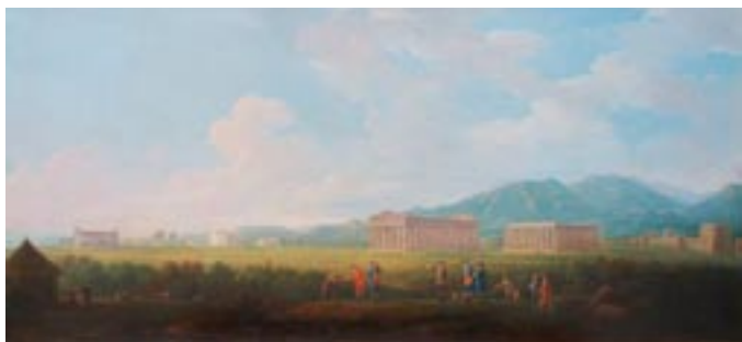
Антонио Джоли Руины храма Пестум, 1765