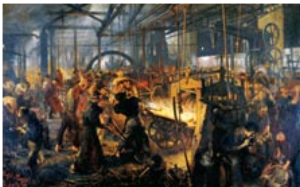
Адольф Менцель Железопрокатный завод, 1872 – 75 г. г.