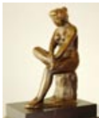
Аристид Майоль Сидящая положившая ногу на ногу, 1902 г.

Наконец-то Национальная галерея на Острове музеев смогла пополнить постоянную выставку первоклассными произведениями. С 1959 г. здесь был представлен XIX век как это было до войны, как часть мирового искусства, хотя главные собрания работ Каспара Давида Фридриха, Шинкеля или импрессионистов попали в связи с эвакуацией в Западный Берлин. Около 190 полотен и скульптур поступили осенью 1958 г. из Советского Союза. 12000 рисунков немецких художников, среди них самая большая часть наследия Менцеля, находились также в ящиках транспорта. Сегодня все они хранятся в Кабинете гравюр. Сенсацию вызвала картина Менцеля «Железопрокатный завод», которая не погибла, как опасались в мае 1945 г. во время пожара в противовоздушном бункере Фридрихсхайна, а возвратилась благополучно домой. Гойя, Графф и Хаккерт, Тишбейн и Вальдмюллер, Блехен и Бёклин, а также Сезанн, Слевогт и Кокоска, все они были теперь представлены важными картинами в главном здании Национальной галереи. Это касается и знаменитой бронзовой статуи Родена «Медный век» и многих других значительных скульптур. Однако около 850 картин и более 100 скульптур считаются после 1945 г. поныне пропавшими.