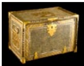
Кабинет письма, начало XVII века