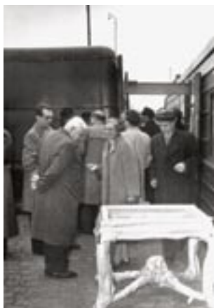
Прибытие первого состава с сокровищем «Зелёных сводов» и других музеев Государственных собраний произведений искусств на Дрезденском вокзале 17-го сентября 1958 г.

Сообщение от 31 марта 1955 г. словно наэлектризовало каждого любителя искусства на Западе и на Востоке: Картины Земперской галереи должны возвратиться! На десять долгих лет «Сикстинская Мадонна» Рафаэля, виды Дрездена Каналетто и «Шоколадница» Лиотара будто бы исчезли с лица земли. В обществе нельзя было и заикнуться о всемирно известных произведениях. До конца мая 1945 г. «Трофейные бригады» конфисковали большую часть картин, находившихся в саксонских туннелях и шахтах. С июля начался перевоз специальными составами сотен тысяч объектов искусства в Советский Союз. Даже в Москве узнали лишь в подготовительный период возвращения искусства, что военные в ноябре 1945 г. выследили последний склад и перевезли около 500 картин в Киев. Оттуда 3-го ноября 1955 г. в Дрезден поступил транспорт, в котором находилось 478 картин, в том числе важнейшие произведения Дюрера, Ян ван Эйка и Вермеера. Между тем было искусно инсценировано возвращение Старых Мастеров из Москвы и Ленинграда. Музей им. Пушкина в Москве собрал 1,2 миллиона восхищённых посетителей, прежде чем картины были переданы в праздничной атмосфере ГДР. В октябре состоялось открытие первой выставки возвращённого в Старой Национальной Галерее. В июне 1956 г. картины переехали в восстановленную Земперскую