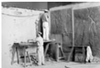
Дворцовое помещение в Переднеазиатском музее во время вмонтирования ассирийского дворцового рельефа, 1959 г.

Переднеазиатскому музею повезло больше всех других собраний, т.к. ему было возвращено почти всё из «трофейного искусства». Музей, документирующий культуру Месопотамии и её соседей за 6000 лет, смог теперь, после нового открытия в октябре 1959 г., представить свои высшие позиции наряду с Лувром и Британским Музеем. Сильно повезло и большим архитектурным ансамблям. Ворота Иштар и Улица Процессии в Вавилоне благополучно пережили бомбировку. Таким образом Переднеазиатский отдел, как музей тогда назывался, почти комплексно уцелел во время капитуляции Германии. В мае 1945 г. последовали кражи и грабежи, а вскоре и вывоз «Трофейными бригадами». С тех пор не доставало значительной части экспонатов. В сентябре 1958 г. всё разом изменилось. Вернулись единственные в своём роде алебастровые рельефы из дворца Ассурназирпала II в Нимруде и другие важные скульптуры из Ассура, Пальмиры и Телль-Халафа, сотни гербовых и роликовых печаток и многое другое. До сих пор не достаёт ряда шрифтовых плиточек из золота, украшений из Ассура и Урука и некоторых печаток.