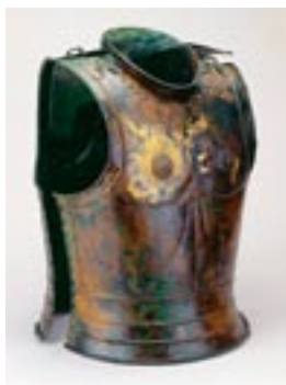
Нагрудная кольчуга, состоящая из двух частей Княжеская могила восточно- гальштатской культуры Стична, Словения, около 600 г. до н.э.