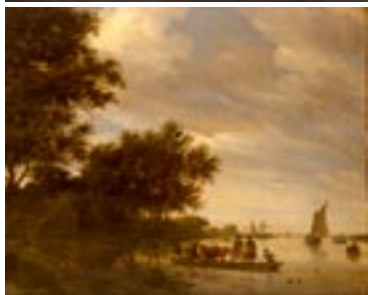
Саломон ван Рейсдал Ландшафт канала с плотом, 1657