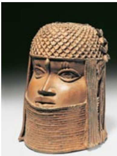
Голова Мудрая короля Нигерия, королевство Бенин, XVII-XVIII век

Этнологический музей Берлин-Далем, называвшийся прежде Музей этнографии, через 32 года после других берлинских собраний, получил долгожданное. В августе 1990 г. в Далем прибыл первый транспорт с драгоценными объектами, которых так болезненно не хватало со времён войны.. Это были девятиметровые столбы «Тотемы» из Канады, щелевые барабаны с Амазонки, знаменитая бронза Бенина. До декабря 1992 г. поступило 50000 оригиналов. Около 75000 предметов этнографии не доставало музею после советской реквизиции летом 1945 г., когда в начале 80 х г. г. дошёл слух, что якобы часть фонда хранится в Лейпциге. В 1985 г. на одном заседании специалистов западноберлинским хранителям музея было заявлено, что фонд был отправлен в 12 транспортах в 1977/78 г.г. из Ленинграда в лейпцигский Музей Грасси, местонахождение крупнейшего этнографического собрания в Восточной Германии. Ящики хранились в нераспакованном виде и блокировали помещение, предназначенное для специальных выставок. После падения берлинской стены фонд можно было предварительно осмотреть в мае 1990 г. И уже несколько месяцев спустя началось сенсационное возвращение.