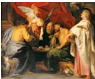
Петер Пауль Рубенс Четыре Евангелиста, около 1614 г.