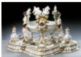
Иоганн Иоахим Кэндлер Настольная ваза «Табель- уфзатц», сервиз генералфель- дмаршала Бурхарда Кристофа Графа фон Мюнниха, Мейссен, 1738