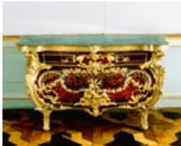
Иоганн Мельхиор Камбли Комод, около 1765 г.

лась небольшая группа скульптур, среди них две значительные больших размеров скульптуры Кусту Младшего из картинной галереи Фридриха Великого и три из четырёх пропавших бюстов Гудона. Из существовавших 2000 предметов мебели Правлению замков было передано 160. К счастью, вернулась почти вся рококо-мебель эбенового дерева из Нового дворца Сан – Суси. Эти предметы обрели своё законное место. В замок вернулось большинство фарфоровых ваз для каминов и консолей. Реституированы были также вся ценная посуда Веджвуда и полки над камином в Мраморном дворце. Однако 3000 предметов восточно-азиатского фарфора осталось в Москве и Ленинграде. Из многочисленных пропавших люстр в замки возвратилось в 1958 г. 20 экземпляров, среди прочих пять важнейших экземпляров зимних комнат замка Шарлоттенбург. Наряду с фондами картин и фарфора ощутимые потери понесло графическое собрание. 350 листов поступили в 1958 г., более чем 2600 остаются, к несчастью, потерянными. Всего Фонд прусских дворцов и парков потерял в 1945–46 г.г. тысячи произведений искусств всех жанров.