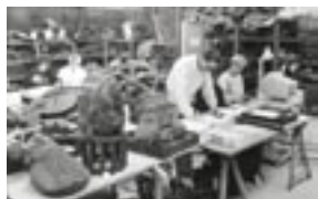
Сотрудник музея во время распаковки возвращённых произведений искусства на месте временного хранилища «Зал Лейпцига»