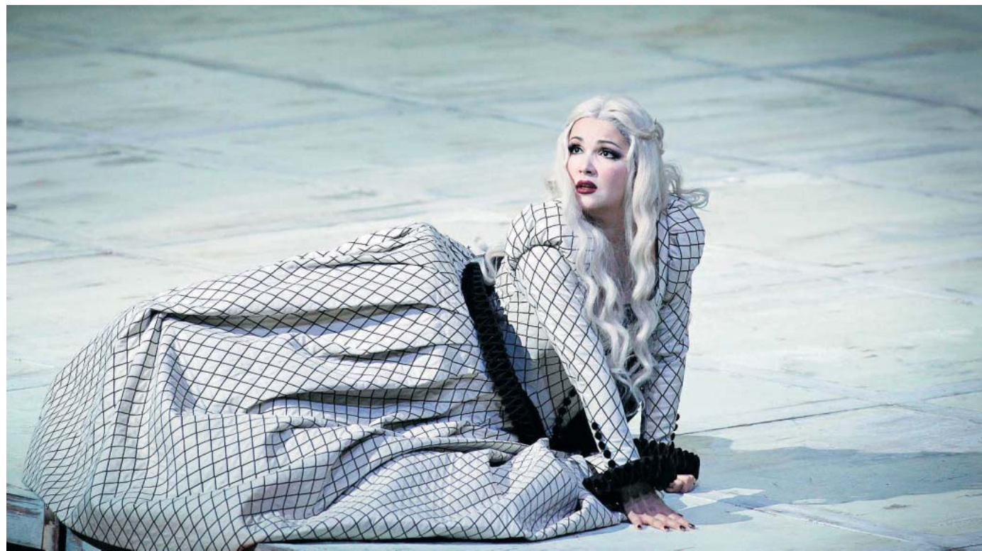
Zur Selbstironie fähig: Anna Netrebko als Leonora in Verdis „Il trovatore“ an der Berliner Staatsoper

ciety geehrt worden. Der Preis wurde 1870 anlässlich des hundertsten Geburtstages von Beethoven erstmalig verliehen. In der Vergangenheit zählten unter anderen Claudio Abbado, Daniel Barenboim, Pierre Boulez und Alfred Brendel zu den Preisträgern. Neben György Kurtág wurde auch der Pianist Andrés Schiff ausgezeichnet. F.A.Z.